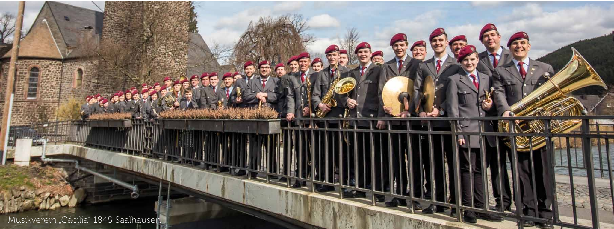
Musikverein „Cäcilia“ 1845 Saalhausen

Der Musikverein „Cäcilia“ 1845 Saalhausen feiert dieses Jahr sein 175-jähriges Bestehen.