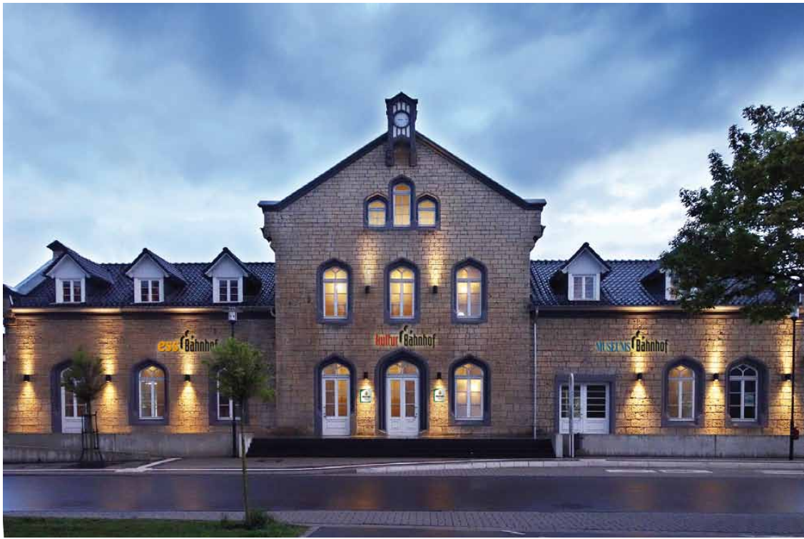
Fahrt Richtung Zukunft – neue Dauerausstellung im KulturBahnhof Grevenbrück