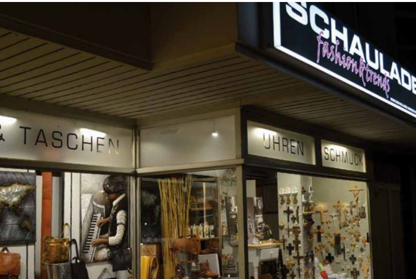
Bei der Schaulade gibt's während des Late-Night-Shoppings nicht nur eine besondere Beleuchtung zu entdecken, sondern ebenso besondere Angebote.

Über 40 Händler und Gastronomen (s.S. 11) – zum Beispiel aus Altenhundem, Saalhausen, Grevenbrück, Elspe oder auch Langenei – haben ihre Teilnahme zugesichert und warten mit tollen Aktionen auf: Gemeinsame