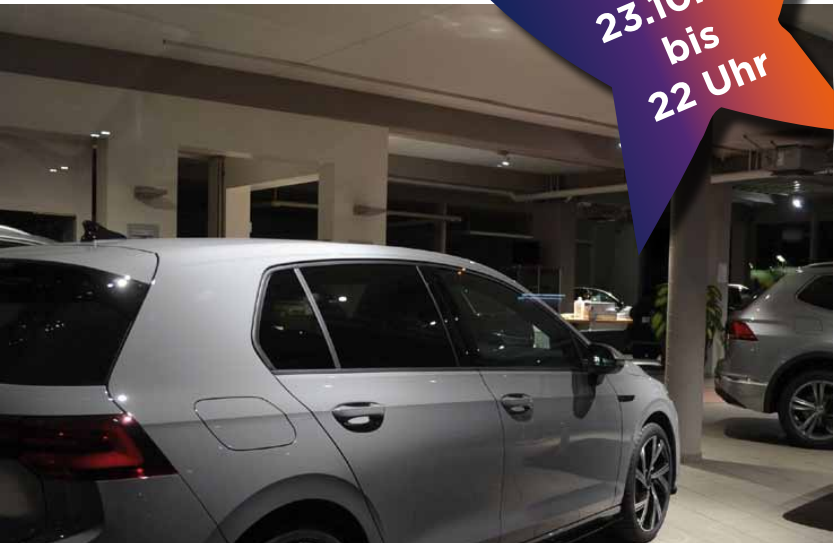
Auch im Straßenverkehr richtige Hingucker: Die Modelle vom Autohaus Egon Baumhoff.

Am 24. und 25. kommen dann weitere Sehenswürdigkeiten und Orte hinzu (siehe Seite 7). Alle SchatzkarteninhaberInnen profitieren während des Late-Night-Shoppings von doppelten Bonuspunkten, gesponsert vom Stadtmarketingverein. Die Punkte werden in der Folgewoche gutgeschrieben.