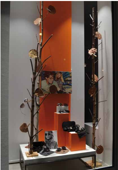
Optik Stipp sorgt bei Dunkelheit oder Licht für den richtigen Durchblick.

Schacht in Meggen, die Burg Bilstein, die Hohe Bracht sowie in Elspe die „Gellestatt“.