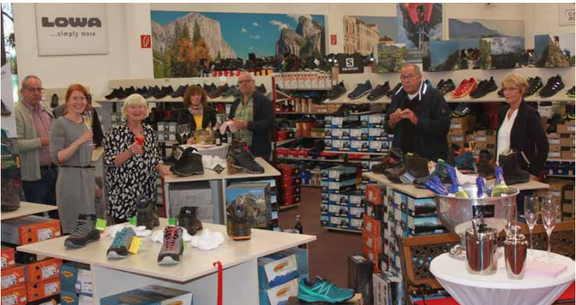
Genießen Sie einen Sektempfang im Einzelhandel, zum Beispiel bei eberts Schuhe

Aus dieser Aktion soll mehr werden als ein leuchtender Versuchsballon: Die Premiere des „Late-Night-Shopping in Lennestadt“ am 23. Oktober könnte der Startschuss für eine neue erfolgreiche Serie in der Stadt werden. Neben der außergewöhnlichen Atmosphäre für die Lennestädter soll die Aktion auch Strahlkraft über den Ort hinaus entwickeln und viele Gäste anlocken.