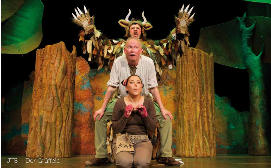
JTB – Der Grüffelo