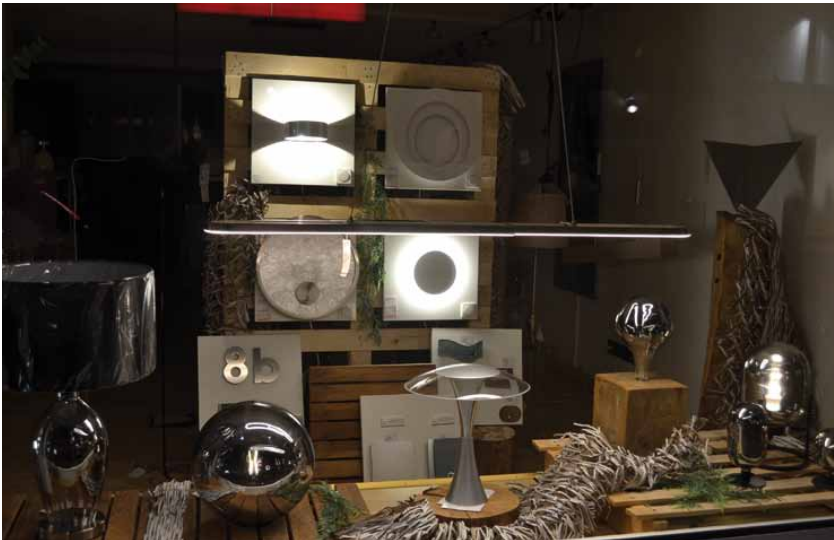
Über das Late-Night-Shopping hinaus steht die richtige Beleuchtung bei Elektro Köster immer im Mittelpunkt.