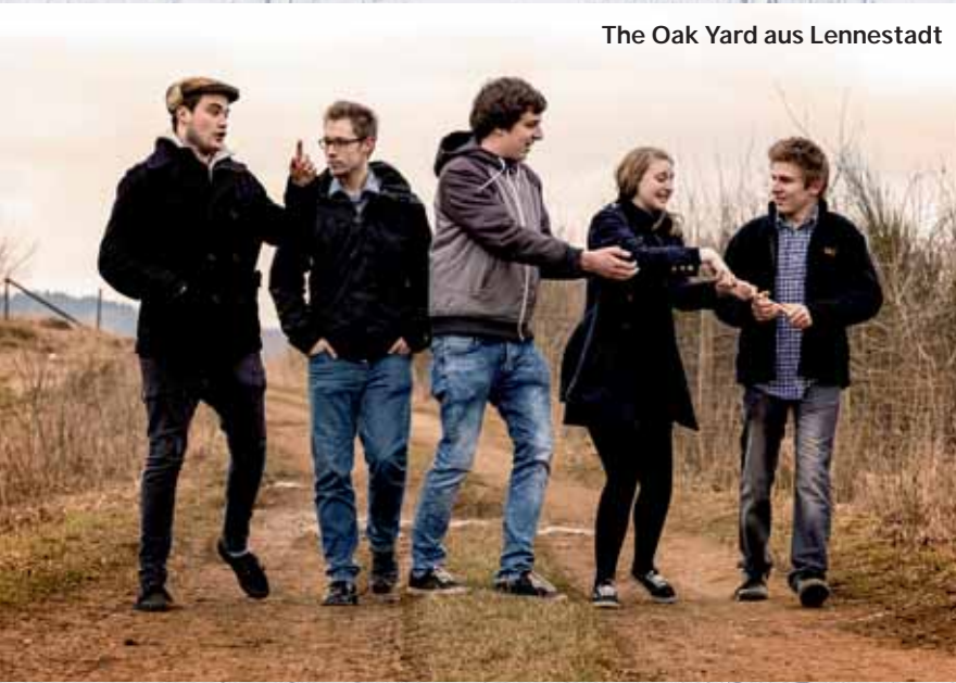
The Oak Yard aus Lennestadt

Kinderpunsch, Punsch, Glühwein und Kaffee in vielen Varianten sowie eine zünftige Feuerzangenbowle erwärmen Herz und Gemüt und laden zum Verweilen und Plausch unter Freunden ein. Erneut haben sich die Verantwortlichen aus dem Aktionsring mächtig ins Zeug gelegt, um ein attraktives, abwechslungsreiches und jedes Alter ansprechendes Unterhaltungsprogramm zusammenzustellen.